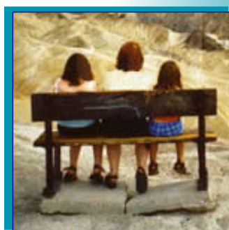
"Een passend advies, daar gaan we voor".

W ij hebben deskundigen op het gebied van particuliere- en zakelijke verzekeringen. Daarnaast adviseren en bemiddelen wij in hypotheek en pensioenen. Het is onze taak om samen met de klant een inventarisatie te maken van de risico's waarmee zij te maken hebben. Hierbij geven wij een advies over welke producten naar onze mening goed bij hun persoonlijke omstandigheden aansluiten.